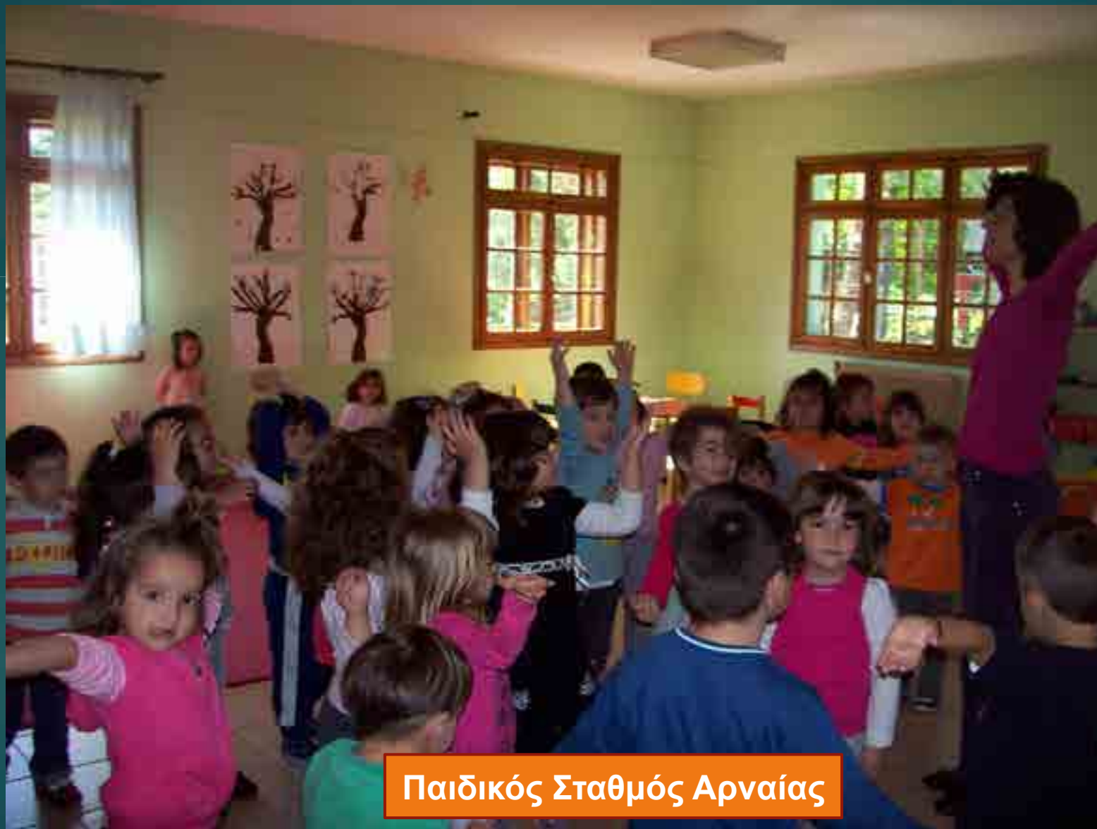
Παιδικός Σταθμός Αρναίας